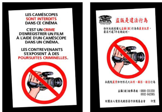
Exemples d'affiches anti-piratage par caméscope utilisées dans le monde.